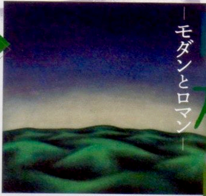
《山》1954年 愛媛県美術館