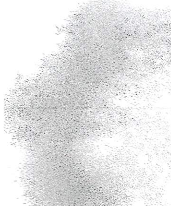
尾長良範《zone》2008年 作家蔵