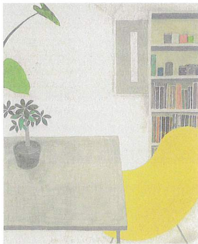
尾長良範《zone》2020年 作家蔵