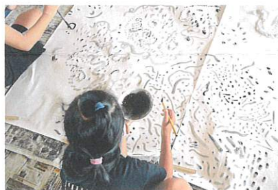
ワークショップの様子(2021年7月26日開催)