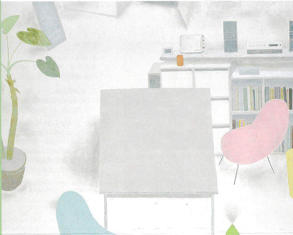
尾長良範〈zone〉2019年 作家蔵

開館時間 午前9時30分〜午後6時(入室は午後5時30分まで) 休館日 月曜日、2月24日 主催 富山県水墨美術館、富山県水墨美術館友の会、富山新聞社、北國新聞社、チューリップテレビ 協賛 トヨタカーローラ富山、スキノマシ、ユニゾン、デュプロ北陸販売(順不同)